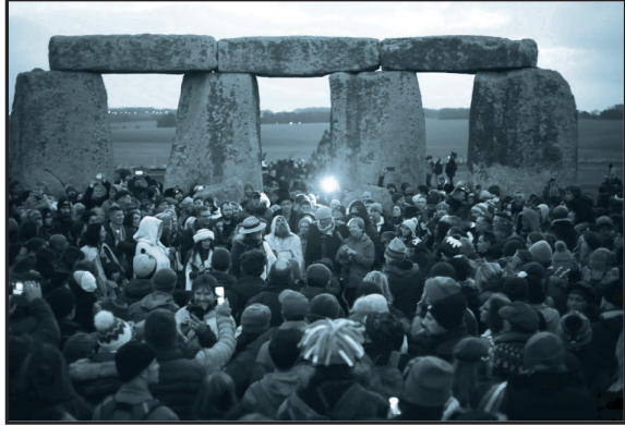
ستونهنج، نصب حجري قديم في إنجلترا، وهو موقع لأنشطة دينية مختلفة.

لدى ديانة العصر الجديد مجموعة متنوعة من الجماعات والمنظمات والأفراد. أتباع «العصر الجديد» ليسوا متحدثين تحت اسم معين أو بيان من المعتقدات. يبدو البعض متدينًا جدًا، فيما يبدو البعض الآخر علميًا وليس متدينًا. لن يقولوا جميعًا إنهم جزء من ديانة العصر الجديد، لكن تجمعهم جميعًا سمات معينة. ١٢