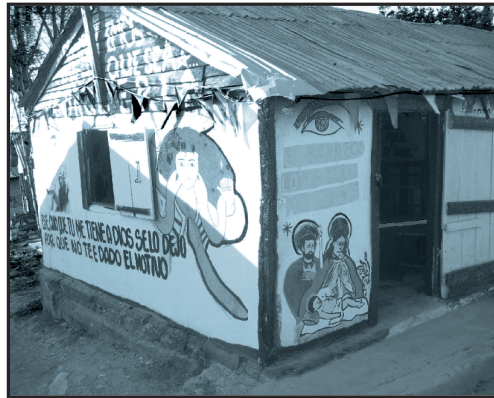
مكتب معالج بالسحر

« لماذا لا يطلب المؤمن مساعدة الأرواح؟ »