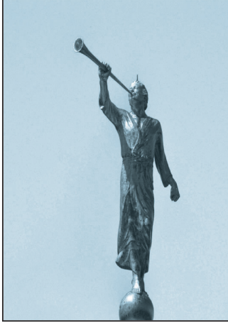
ثمة تمثال للملاك موروني أعلى كل معبد مورمون.

بحسب عقيدة المورمون، كان كل إنسان روحًا في السماء قبل أن يُولد. وكان قد شنت حرب في السماء، وأولئك الذين لم يقاتلوا بأقصى ما عندهم من أجل الله لُعنوا ببشرة داكنة. الرجال المقتبس عنهم هذا الكلام كانوا جميعًا رؤساء لكنيسة المورمون ولا يزال المورمون يعتبرونهم أنبياء الله. قال جوزيف سميث إن أصحاب البشرة الداكنة إذا آمنوا بعقائد المورمون وعملوا حسنًا، فإن بشرتهم ستصبح أفتح بعد عدة أجيال. وقال بريغهام يونغ إن البشرة السوداء والأنوف المسطحة هي لعنة قايين. وقال إنه مبدأ أزلي من الله أن الرجل ذو الدم الإفريقي لا يستطيع أن يتولى الكهنوت. وقال أيضًا إن عبودية السود مؤسّسة إلهية. فيما قال جوزيف فيلدنغ سميث إن السود يحصلون على ما يستحقونه في العالم بسبب ما فعلته أرواحهم قبل ولادتهم. وقال ديفيد مكاي إن تمييز الكنيسة ضد «الزنجي» لم يبدأ من الإنسان بل الله. ١٧