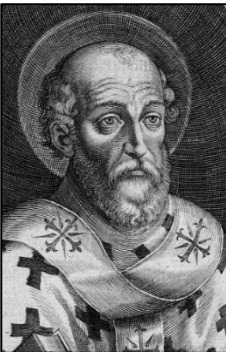
አትኔቬየስ ካ. 296-373, በ” ኦን ዘ ኢንካርኔሽን” ታዋቂ ድርሰት ጽፏል። በዚህም የእየሱስ ምሉእ መለኮት እና ሙሉ ሰውነት ለክርስትና እምነት ለምን በጣም አስፈላጊ እንደሆነ ገልጾ ነበር። እሱ የኒቂያ የሃይማኖት መግለጫ ከወጣበት በኋላ ምክር ቤት ውስጥ ተፅእኖ ነበረው።

መጽሐፍ ቅዱስን እናምናለን የሚሉ አሁንም መጽሐፍ ቅዱስን የሚቃረኑ ትምህርቶችን የሚያስተምሩ ሁልጊዜ አሉ። ቤተ ክርስቲያን እውነተኛውን ክርስትና ከሐሰት ትምህርቶች የሚለይ የመጽሐፍ ቅዱስ አስተምህሮ መግለጫዎችን አዘጋጅታለች።